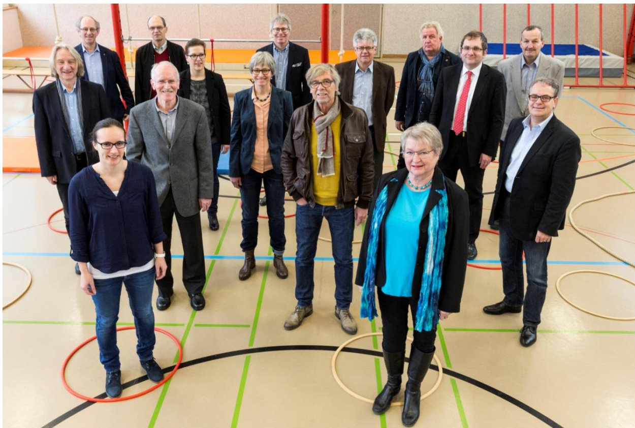
ZSP Januar 2015